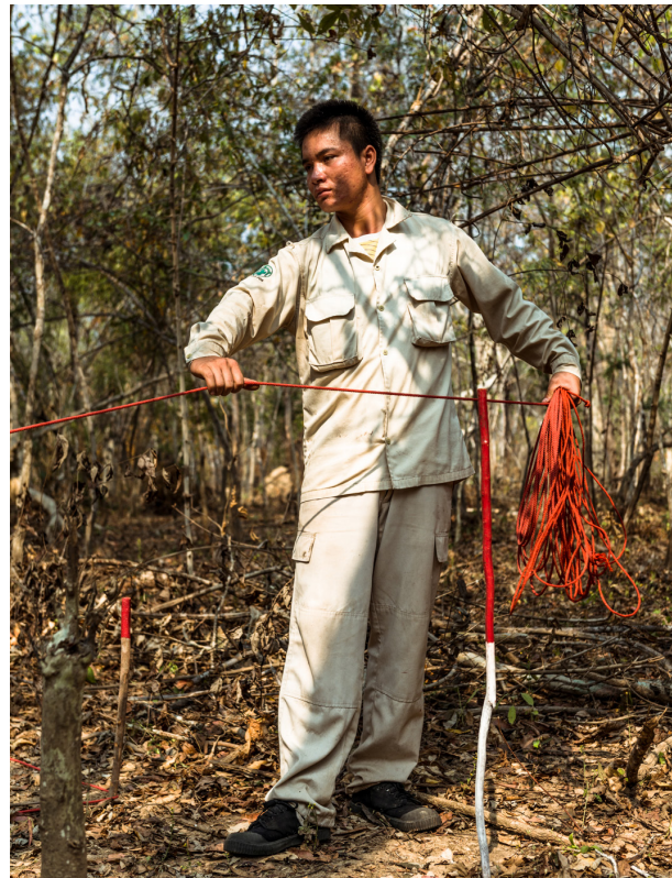
ອົງການເອັນພີເອ ກຳລັງກະກຽມສະໜາມເພື່ອເຮັດການສຳຫຼວດ.

ເມືອງບົວລະພາ ແມ່ນເມືອງທີ່ມີຜົນກະທົບໜັກຈາກ ລູບຕຢູ່ແຂວງຄຳມ່ວນ. ອົງການແມັກແມ່ນອົງການທີ່ເຮັດວຽກແກ່ໄຂບັນຫາ ລູບຕ ມາຫຼາຍປີເມືອງແຫ່ງນີ້ ແລະ ມີຂໍ້ມູນການທົ່ວລາຍ ລູບຕ ເຄືອນທີ່ເປັນຈຳນວນຫຼາຍ ແລະ ໜ້າເຊື່ອຖືໄດ້ ແຕ່ອາດິດຈົນຮອດປີ 2008. ພາຍໃຕ້ໂຄງການດັ່ງກ່າວ ອົງການເອັນພີເອ ຈະນຳໃຊ້ຂໍ້ມູນການທຳລາຍ ລູບຕ ເຄືອນທີ່ເຂົ້າໃນຂະບວນການສຳຫຼວດ ລູບຕ ເພື່ອຫຼີກລ່ຽງການສຳຫຼວດຊອກຫາ ລູບຕ ໃນພື້ນທີ່ຮ້າຮຸ່ວາມີ ລູບຕ ຕົກຄາງແລ້ວ. ຫຼັງຈາກນັ້ນ, ອົງການແມັກ ຈະນຳເອົາຂໍ້ມູນຈາກອົງການເອັນພີເອ ໄປວາງແຜນການກວດກາ. ນອກຈາກນັ້ນ, ອົງການເອັນພີເອ ຍັງຈະປະສານສົມທົບກັບອົງການຈັດແມັບເພື່ອສາງພື້ນຮູບເງົາໃນໄຕມາດ 1 ປີ 2016. ພ້ອມດັ່ງກ່າວ ຈະສະແດງໃຫ້ເຫັນຄວາມສຳຄັນຂອງເພດຍິງໃນການແກ່ໄຂບັນຫາ ລູບຕ.