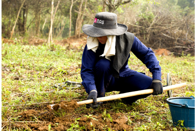
ທີມກວດກູ້ຍິງຂອງອົງການແມັກຢູ່ທີ່ແຂວງຊຽງຂວາງ ກຳລັງໃຊ້ສຽມຈື່ມດິນຢ່າງລະມັດລະວັງ ເພື່ອຊອກຫາ ລບຕ.

ໃນປີ 2018, ພະນັກງານພົວພັນຊຸມຊົນ ໄດ້ລົງດຳເນີນການສຳຫຼວດບໍ່ແມ່ນວິຊາການຢູ່ໃນ 37 ບ້ານ. ໃນຊ່ວງທີ່ລົງເຄື່ອນໄຫວນັ້ນ ຊາວບ້ານແຕ່ລະຄົນແມ່ນໄດ້ເຂົ້າມາມີສ່ວນຮ່ວມໃນການໃຫ້ຂໍ້ມູນກ່ຽວກັບຈຸດຫຼັກຖານ ລບຕ ຕົກຄ້າງທີ່ເຂົາເຈົ້າເຄີຍເຫັນມາກ່ອນ. ວິທີການທີ່ພະນັກງານພົວພັນຊຸມຊົນນຳໃຊ້ແມ່ນປະ