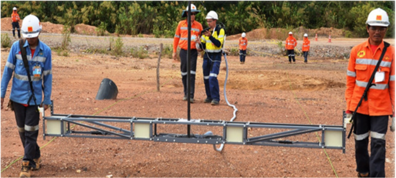
ຜົນສໍາເລັດການສ້າງຂີດຄວາມສາມາດໃຫ້ພະນັກງານໃນປີ 2018: