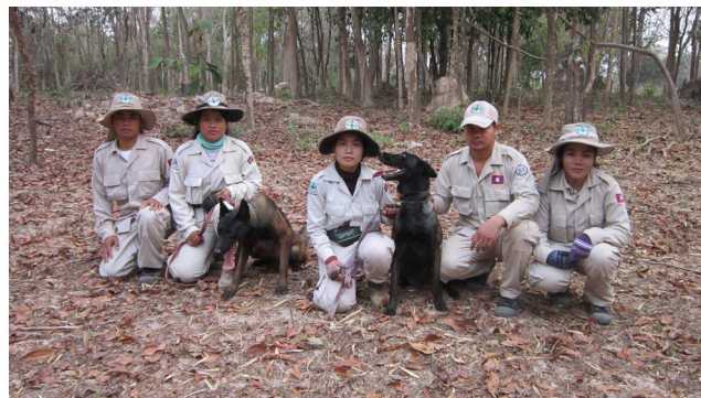
ພະນັກງານຂອງອົງການເອັນພີເອ ກຳລັງໃຊ້ໝາດົມຊອກຫາລະເບີດລູກຫວານ.

ການທົດລອງໃຊ້ໝາດົມລະເບີດ ໄດ້ດຳເນີນຢູ່ແຂວງສາລະວັນ, ຊຶ່ງບົດຮຽນໄດ້ຖອດຖອນມາຈາກອົງການຊື່ແມັກຂອງກຳປູເຈຍ ທີ່ປະສົບຜົນສຳເລັດມາແລ້ວເປັນເວລາຫຼາຍປີຢູ່ບານເພີນ. ການທົດລອງດັ່ງກ່າວນີ້ ແມ່ນເຮັດຮວມກັບ ຄຊກລ ເພື່ອທົດສອບກ່ຽວກັບຄຸນນະພາບ ແລະ ຄວາມຄຸ້ມຄຸ້ມໃນການນຳໃຊ້ໝາດົມລະເບີດລູກຫວານ. ຜົນຈາກການທົດລອງບອກໃຫ້ຮູ້ຄາງວ່າ ໝາສາມາດດົມຊອກຫາລະເບີດລູກຫວານໄດ້ແທ້ແຕ່ບໍ່ສາມາດດົມກຸ້ນສິ້ນສວນຂອງ ລບຕ ອື່ນໆໄດ້. ນອກຈາກນັ້ນ, ຍັງສາມາດຮູ້ຕື່ມອີກວ່າ ການນຳໃຊ້ໝາດົມຊອກຫາລະເບີດລູກຫວານ ແມ່ນໃຊ້ຕົ້ນທຶນສູງ, ທຽບໃສ່ການນຳໃຊ້ຄົນ. ປະຈຸບັນນີ້ ບົດລາຍງານສຸດທ້າຍແມ່ນກຳລັງຮາງຢູ່ ແລະ ຈະແລກປ່ຽນກັບ ຄຊກລ ແລະ ຄູ່ຮວມປະຕິບັດງານອື່ນໆໃນມື້ນີ້. ແຕ່ເຖິງຢ່າງນັ້ນກໍຕາມ, ອົງການເອັນພີເອ ກໍຍັງຈະສືບຕໍ່ທົດລອງໝາດົມລະເບີດລູກຫວານອີກຕື່ມໃນປີ 2019.