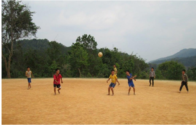
ເດັກເຜະບານໃໝ່ ຫຼັງຈາກທີ່ກວດກູ້ ລບຕ ອອກແລ້ວ (ໂຮງຮຽນປະຖົມບ້ານດົງດານ, 8 ເມສາ 2018).

ນອກຈາກນັ້ນ, ທີມງານພົວພັນຊຸມຊົນຂອງອົງການແມັກ ຍັງໄດ້ລົງເຄື່ອນໄຫວກິດຈະກຳໂຄສະນາສຶກສາຄວາມສ່ຽງຈາກລບຕຢູ່ 106 ບ້ານ ເນື່ອງຈາກວ່າ ເດັກນ້ອຍແມ່ນກຸ່ມທີ່ມີຄວາມສ່ຽງຕໍ່ການເກີດອຸບັດເຫດຈາກ ລບຕ ຫຼາຍທີ່ສຸດ. ໃນປີ 2018 ມີຜູ້ເຂົ້າຮວມກິດຈະກຳໂຄສະນາສຶກສາຄວາມສ່ຽງຈາກ ລບຕ 42,746 ຄົນ ໃນນັ້ນ 32,669 ແມ່ນເດັກນ້ອຍ, 15,827 ແມ່ນເດັກຍິງ ໃນໄວອາຍຸ 5 ຫາ 16 ປີ. ນອກຈາກນັ້ນ, ອົງການແມັກຍັງໄດ້ຝຶກອົບຮົມໃຫ້ອາສາສະໜັບກບານຢູ່ໃນ 39 ບ້ານ ແນໃສ່ໃຫ້ເຂົາເຈົ້າເຮົາໄປຝຶກສອນຕໍ່ຜູ້ຕາມຊຸມຊົນຕ່າງໆພາຍໃນບ້ານຂອງເຂົາເຈົ້າ ແລະ ອົງການແມັກ ກໍໄດ້ລົງທິດຕາມການເຄື່ອນໄຫວຂອງເຂົາເຈົ້າເປັນແຕ່ລະໄລຍະ ເພື່ອໃຫ້ການຊ່ວຍເຫຼືອ. ວຽກງານໂຄສະນາສຶກສາຄວາມສ່ຽງຈາກ ລບຕ ແມ່ນສວນໜຶ່ງທີ່ຖືກເຊື່ອມສູນເຂົ້າໃນຫຼັກສູດການຮຽນ-ການສອນໃນຊັ້ນປະຖົມ ແລະ ໃນຕົ້ນປີ 2016 ອົງການແມັກ ຈະເຮັດວຽກຮ່ວມກັບພະແນກສຶກສາ ແລະ ກິລາ ແຂວງຊຽງຂວາງ ເພື່ອຈັດການຝຶກອົບຮົມໃຫ້ຄູສອນຢູ່ 33 ໂຮງຮຽນກ່ຽວກັບການສິດສອນວິຊາ ລບຕ ແລະ ການປະຖິ້ມພະຍາບານຂັ້ນຕົ້ນ.